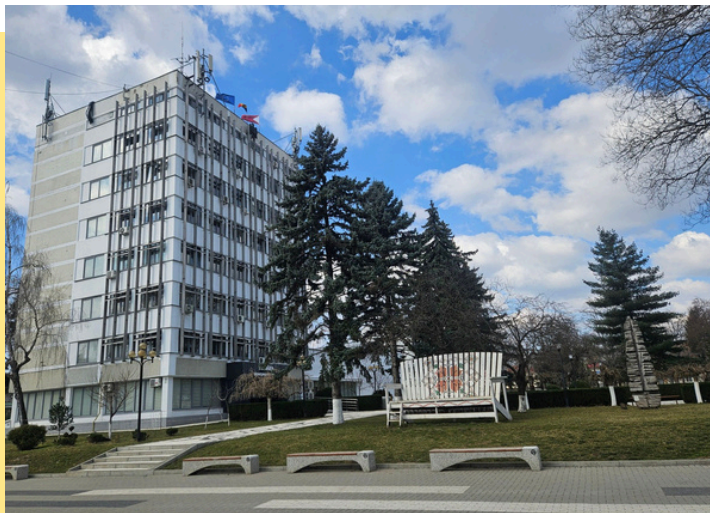
Primăria municipiului Ungheni

Municipiul Ungheni este situat în partea central-vestică a Republicii Moldova, pe malul estic al râului Prut. Potrivit datelor ultimului recensământ (2024), este al treilea oraș ca mărime din țară, după Chișinău și Bălți, având o populație de peste 26 mii de locuitori.