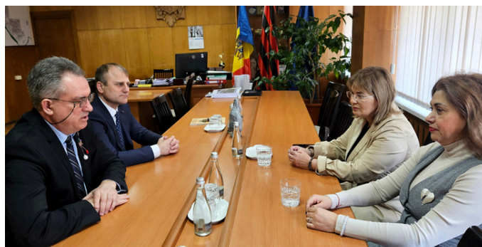
În vizită la Ungheni

Primarii celor două municipii și-au exprimat dorința fermă de a oficializa relațiile dintre Ungheni și Tulcea prin semnarea unui acord de colaborare și înfrățire, care să consolideze parteneriatul existent și să deschidă noi oportunități de dezvoltare reciprocă.