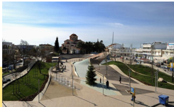
Municipiul Thermi între piatră și natură

În plus, există o activitate comercială semnificativă, unele dintre cele mai mari centre comerciale din Salonic fiind situate anume la Thermi. De o importanță majoră e și Aeroportul Internațional „Macedonia” din Thermi, cu un număr mare de locuri de divertisment, cazinouri și complexe hoteliere importante.