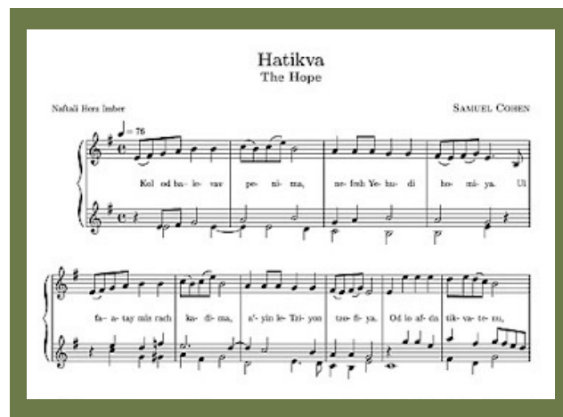
Fragment din imnul Israelului