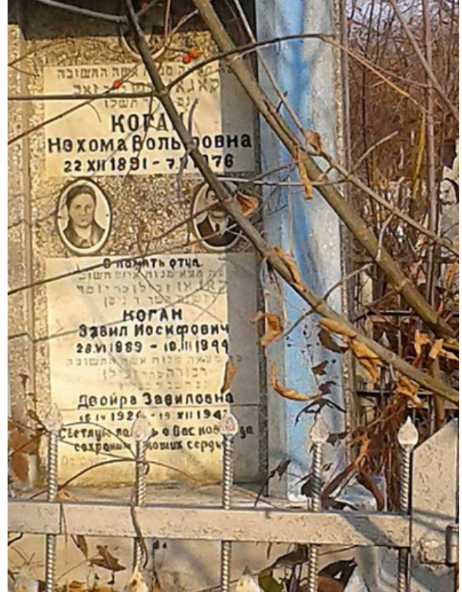
Fotografie din cimitirul de pe strada Alexandru cel Bun din Ungheni, anul 2014