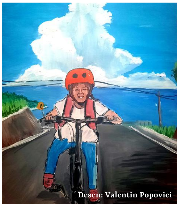
Desen: Valentin Popovici

- Să se organizeze mai multe activități de promovare a ciclismului.