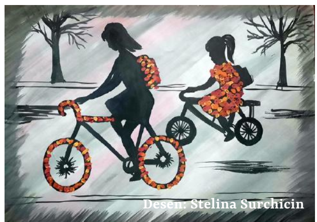
Desen: Stelina Surchicin

!! Acest Buletin este ilustrat cu desenele participanților la Concursul „Merg la școală cu bicicleta”, elevi ai instituțiilor de învățământ din municipiul Ungheni