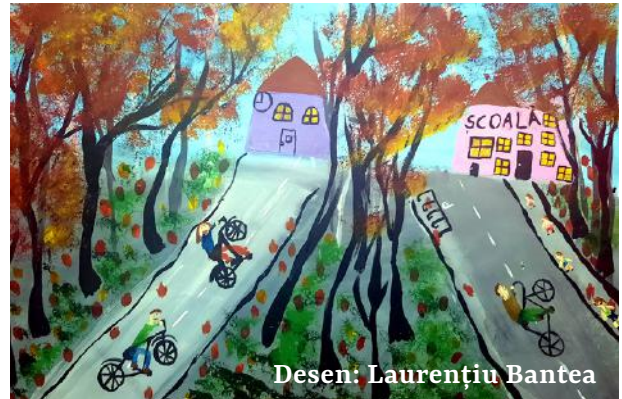
Desen: Laurențiu Bantea

Atât campania, cât și concursul de desene și fotografii fac parte din proiectul „Dezvoltarea transfrontalieră a transportului prietenos mediului”, finanțat de Uniunea Europeană în cadrul Programului Operațional Comun România - Republica Moldova 2014-2020 și implementat de Primăria municipiului Ungheni, în parteneriat cu Primăria municipiului Dorohoi și Centrul Regional de Dezvoltare Durabilă.