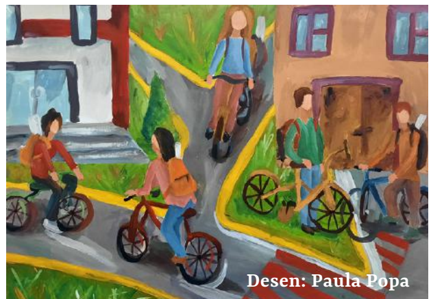
Desen: Paula Popa