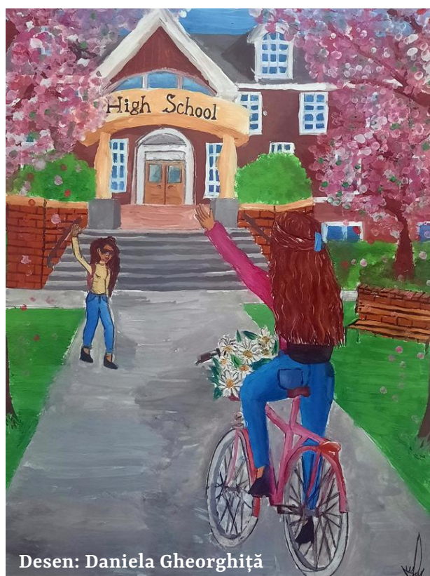
Desen: Daniela Gheorghită

Cei mai mulți respondenți – 43% (dintre elevi) și 36,2% (dintre adulți) au spus că folosesc bicicleta