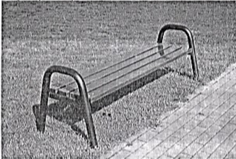
Banca pentru parc fara spatar Dim L 1.80m x H 0.60m x l 0.60m